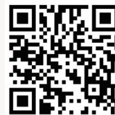
セミナー申込用QRコード

お申込み方法:右記QRコードよりお申込みください。 お申込期限:令和6年1月10日(水)17時まで