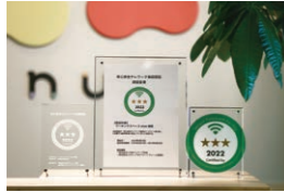
「安心安全テレワーク施設 認証プログラム」の プレミアムグレードの認証を取得