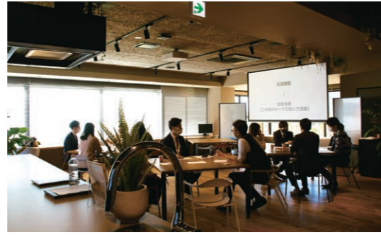
セミナーやイベントなど、 自由な使い方ができる大型スクリーンを備えたイベントスペース

「都会の企業からワーケーションで島根に来て働いてもらうとき、都会に劣るビジネス環境だったラストストレスになり島根も嫌いになってしまふ。都会と島根の差は環境の差であって、その差を解消できれば島根で働きたいという人も増える。今、地域は人口減少が課題となっているが、