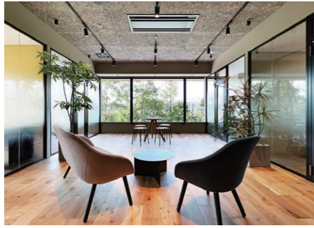
都会的なデザインに松江らしさを取り入れ ストレスなく仕事ができる環境を整えている