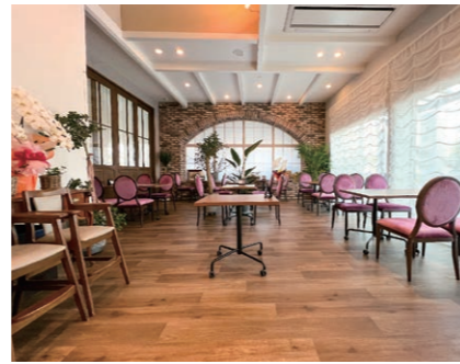
アーチ状の大きな窓を引く店内 テーブルを除いてフォトスタジオに

様々なニーズに対応し 顧客と共に歳月を重ねる 商業地田和山に3月末オ ープンした「ドゥ・テラス」は、 県の新型コロナウイルス対応 経営革新支援事業の認定によ る補助金を活用した新規事業 で、カフェとフォトスタジオ が一体となった新しいスタイ ルの店だ。店内正面奥のアー チ形にレンガを組み上げた飾 り窓のしつらえがスタイリッ シュで人目を引きつけ、自然 光がたっぷりと注ぎ込む大き な窓からは印象的な柱のあ る白色を基調としたテラス席 も見える。どこを切り取って も絵になる、今の言葉でいう 「映える」造りとなっている。 こうしたまるで映画のセット の中にあるような空間でカ フェタイム、ランチタイムを ゆったりと過ごすことができ るのがこの店のセールスポイ ントだ。 ここで撮影されるウエ ディングフォトにはオートク チュールのウエディングドレ スや韓国の撮影技法、編集技 術を取り入れ話題となってい