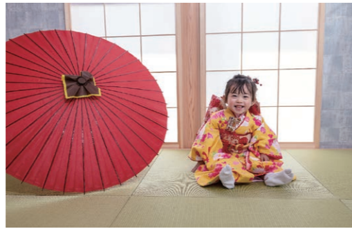
七五三の撮影もご予約受付中です 衣裳・ヘアメイクもお任せください