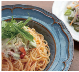
撮影の予約がある場合、 カフェの営業は14:00まで 撮影後のお食事や、貸し切りでのパ ーティーとしてもご利用いただけます