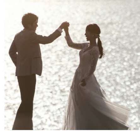
二人の幸せな姿を、映画のワンシーンのように美しく残 します 宍道湖畔や思い出の場所などさまざまなロケーションで の撮影が可能

るノーブルジャパンのノウハ ウを導入した。 「映画界で活躍するクリエ イターが手掛けるプレミアム なウエディングフォトスタッ ジオで、新郎新婦の様々な表 情やポーキングを演出し、撮 った写真は世界有数のレタッ チ技術で加工しますので、従 来のものを凌ぐ豊かなイメー