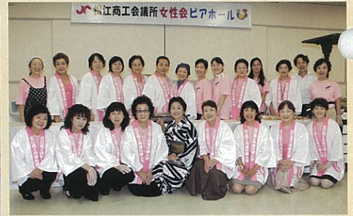
初めてのピアホール開催