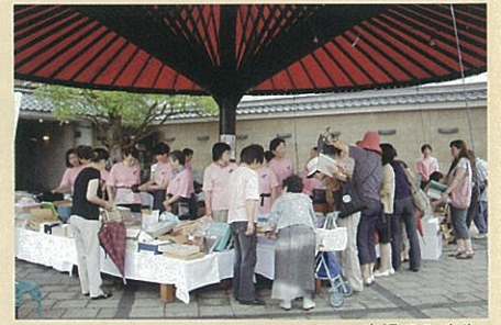
カラコロ広場でのバザー