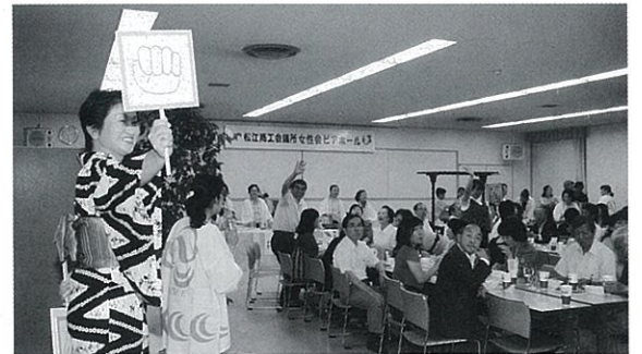
じゃんけんゲーム盛り上がりました!

8月28日会議所大会議室にて、女性会ビアホールが盛大にオープン！お揃いのハッピー姿で並んで笑顔でのお迎えはさすが女性会という感じで圧巻！またメニューも心がこもってしかもベテランおふくろの味で美味(*^_^*)いつもの会議室が大ビアホールに一変し、笑い声や話し声であちこと盛り上がり、席も足りない位の大賑わいでした!! 準備他さぞかし大変だった事と思われていますが、皆様のさわやかな笑顔とテキパキの対応がすごく印象的で女性会パワーを感じたイベントでした。楽しい一夜に感謝と乾杯を。