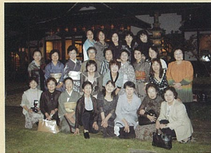
千手院にて観月会