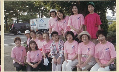
水郷祭あとの清掃