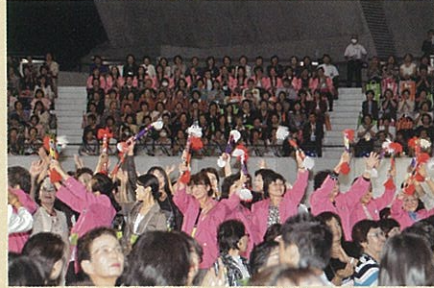
全国大会での、当女性会のアピール姿が日本商工会議所ニュースに掲載されました