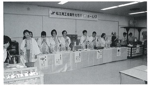
おでん、焼とり、からあげ、漬物など多彩なメニュー