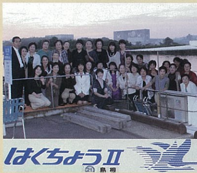
▲船上からの観月会