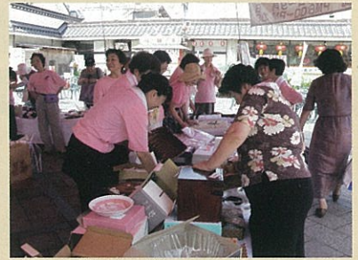
▲カラコロ広場でのバザー