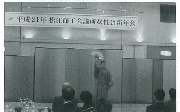
三谷会員による祝舞