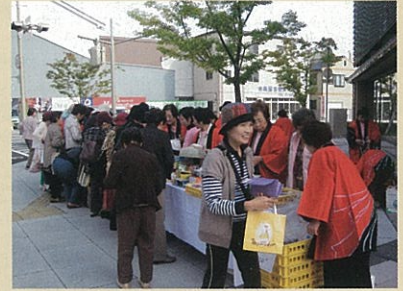
▲初めて試みたおかげ天神でのバザー