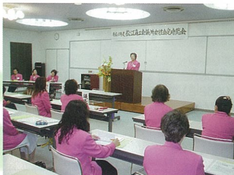
5/22 松江商工会議所女性会総会