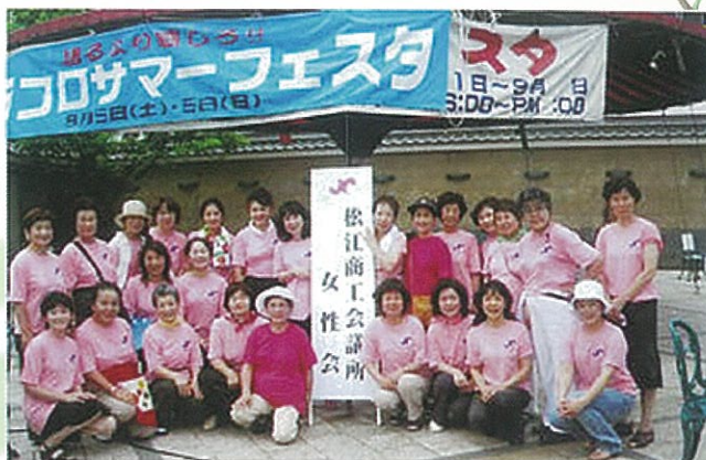
8/5 松江水郷祭協賛バザー