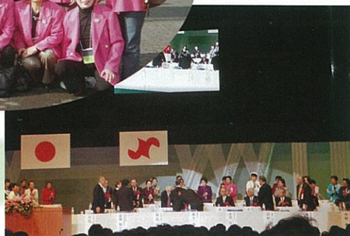
11/21・22 第38回全国商工会議所女性会連合会三重全国大会