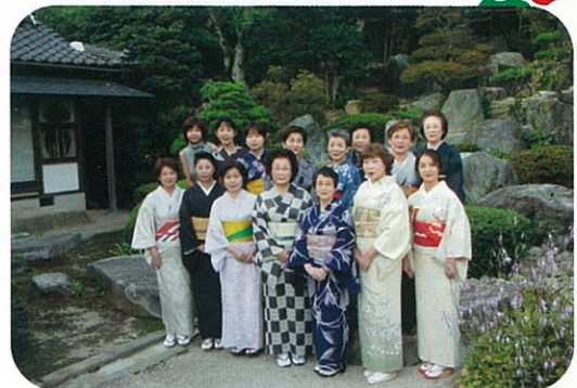
9/28 観月会 ゆかた姿でおもてなし