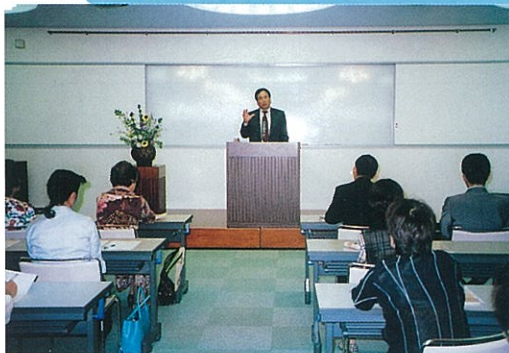
9/6 定例会 青年部と一緒に個人情報保護法に ついての講演会