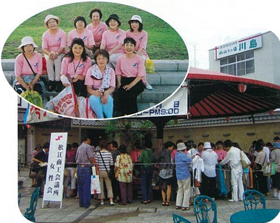
8/6・8/7 水郷祭 バザー・掃除 完売おつかれさま