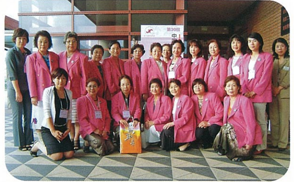
7/22 中国地方商工会議所女性連合会倉吉大会