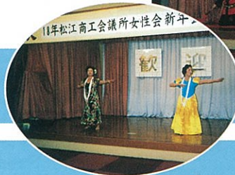
1/24 新年会 佳翠苑皆美 だんだん腕ががります