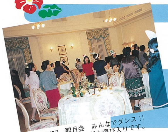
9/27 観月会 みんなでダンス！！ かわいいウサギも飛び入りです。