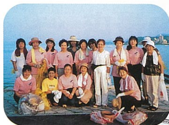
8/9 水郷祭掃除 美術館のまわりがぐーんと きれいになりました