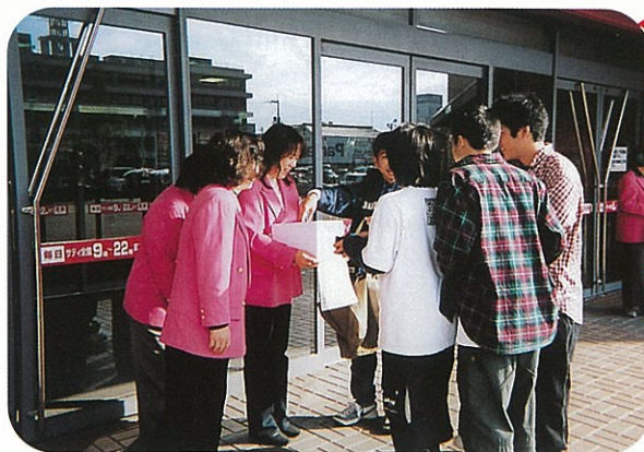
11/13 こんな目頭の熱くなる場面が いくつもありました！