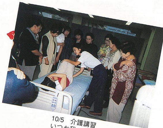
10/5 介護講習 いつか我が身？