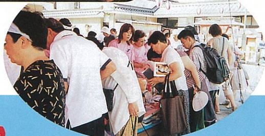
8/7 水郷祭 例年通り賑わいました