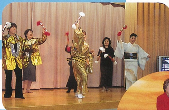
1/17 新年会 玉造白石家 マツケンサンバの賑わいは 今年の女性会の明日のようです！！