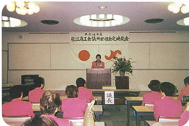
5/20 総会 多数参加され盛大に開催された