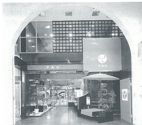
千茶荘 京店営業所

珍しく、味をまろやかにするため抹茶とブレンドする技術もその時生まれました。現在市内に四店舗を構え消費者ニーズに合った商品づくりを目指しています。