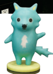
マスコットキャラクター「パルル」 デザイン・データ作成から印刷まで、お任せください