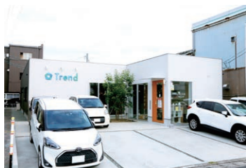
嫁島町の交差点から一本入ってすぐ デザインのお困りごと、 なんでもご相談ください

株式会社 トレンド 〒690-0047 松江市嫁島町11-22 TEL0852-61-0338 FAX0852-61-0339 営業 9:00~17:00 土日・祝日 https://www.thanks-trend.com/ ホームページはコチラから▶