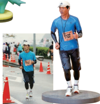
写真を元に、 3Dのフィギュアを作成 お持ちのペットの写真、 イラストなども 3D化が可能です

く記入できる内容となっており、障がい児とその母親をサポートする手帳だ。市販のものでは書きこめない母親の辛さという気づきが生み出したオリジナル商品で、ネットを通じて全国各地から問い合わせ、購入があるという。「パインダ式の装丁、手帳の中の紙質や色合い、デザインなど