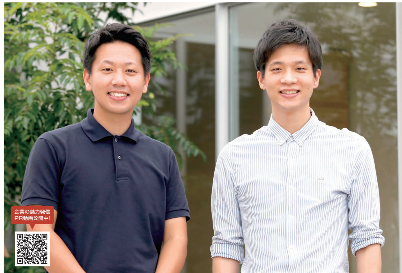
企業の魅力発信 PR動画公開中!

株式会社トレンドの企画営業やデザイン、データ化などは女性スタッフ5名が当たる。その全員が子育て中の母親であり、デザイナーの一人は産休・育休の後、岡山からテレワークで業務に就く。ワークライフバランスといわれて久しいが、ここでは有休取得など各種制度の充実はもちろん、研修や資格取得なども会社が全面的にバックアップする。「子どもができる」と自分の成長をあきらめる人もいるが、ここではスキルアップが可能。お互いさまと助け合う空気もあり働きやすい」という声もある。昨年は県知事の「いきいき雇用賞」を受賞するなどその評価は高い。また女性スタッフミーティングでの「障がいのある子のための育児手帳つないよね」という話からアイデアが生まれ、1年かけて作り上げた「cocoe」は、投葉や体調を細か