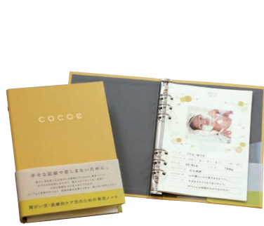
障がい児を育てるご家族の力になりたい、とcocoeを立ち上げ「育児ノート」を企画・製作