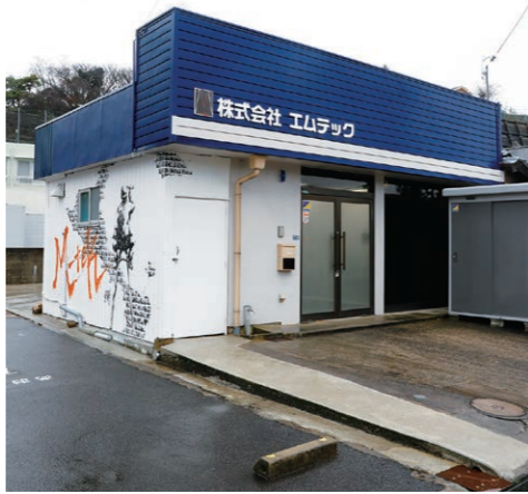
上乃木にある青葉病院の南側にある事務所。格好よく描かれたモノクロの壁画が目印です