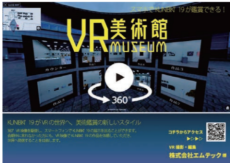
賃貸物件やリフォーム後の仮想内見をはじめ、店舗や会社、イベント会場や観光地の案内などVRの活用方法はさまざま