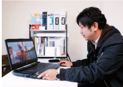
撮影した写真や動画データの編集・調整を行いVR用の映像に加工していきます